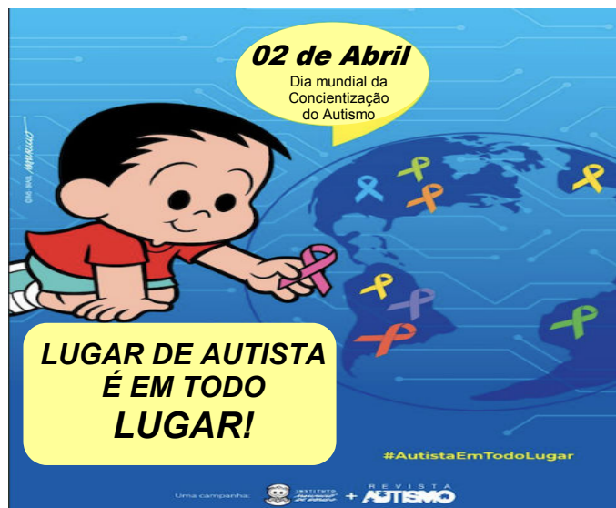
Cartaz oficial da campanha nacional 2022 para o Dia Mundial de Conscientização do Autismo. Disponível em: https://www.canalautismo.com.br/noticia/ . Acesso em: 18 out. 2022. Adaptado.