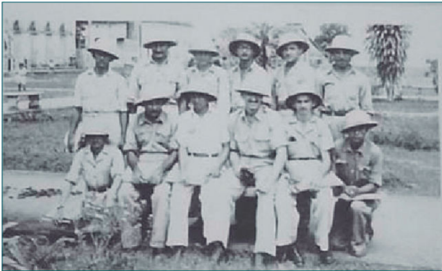
Turma de Guardas Sanitários de 1944.

No Brasil, a história da saúde pública foi marcada pela tentativa de eliminar grandes surtos epidêmicos desde períodos coloniais, como a febre amarela, e outros que surgiram posteriormente ao longo dos anos, como a malária, a leishmaniose e a doença de Chagas, surgindo, dessa forma, a necessidade do agente de combate às endemias (ACE). Os ACE eram conhecidos como guardas da malária, guardas da dengue, guardas da esquistossomose, entre outros, por atuarem apenas no âmbito de uma doença (Figura a seguir).